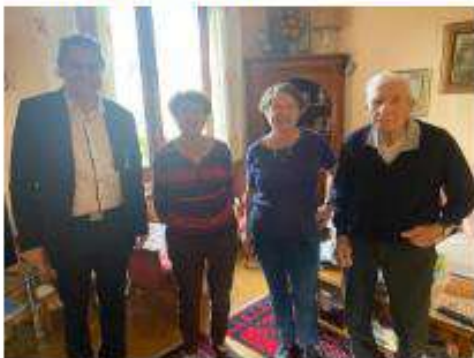
Général de brigade GROSJEAN René