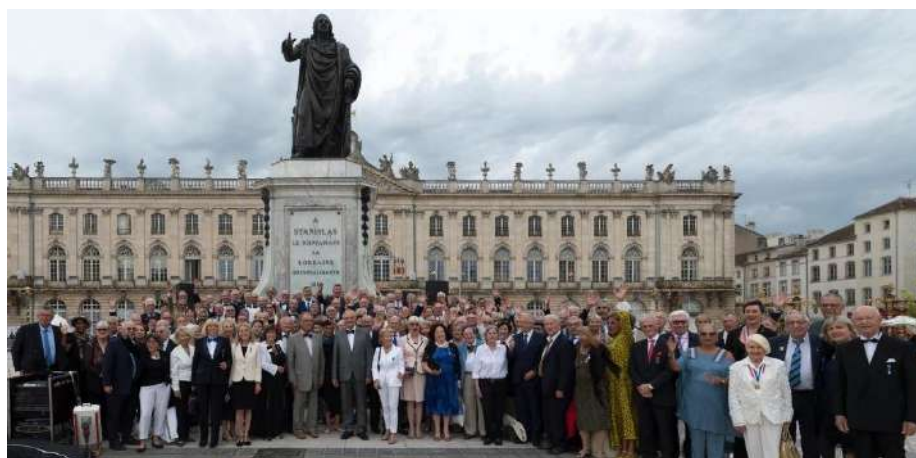
Photo de groupe sur la place Stanislas de Nancy avant le gala

Le Congrès national de l'ANMONM s'est déroulé à NANCY, du 22 au 24 juin 2022 où la Section 73 était représentée par votre présidente.